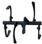
КОМПЛЕКТ РЫХЛИТЕЛЕЙ ДЛЯ КУЛЬТИВАТОРОВ 588 26 72-01