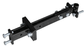
СЦЕПКА ДЛЯ ПРИСОЕДИНЕНИЯ ПРИЦЕПНЫХ АКСЕССУАРОВ КУЛЬТИВАТОРОВ 588 26 60-01