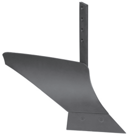
ПЛУГ РАСПАШНОЙ ДЛЯ HUSQVARNA TF 230 588 26 67-01