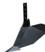
ПЛУГ - ОКУЧНИК ДЛЯ КУЛЬТИВАТОРОВ 588 26 64-01