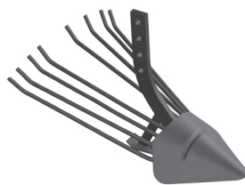
ПЛУГ-КАРТОФЕЛЕВЫКАПЫВАТЕЛЬ ДЛЯ HUSQVARNA TF 338 588 26 63-01