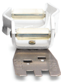
КОМБИНИРОВАННЫЕ ШАБЛОНЫ ДЛЯ ЗАТОЧКИ 505 69 81-09