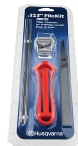
ЗАТОЧНЫЕ НАБОРЫ 505 69 81-25