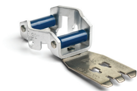
КОМБИНИРОВАННЫЕ ШАБЛОНЫ ДЛЯ ЗАТОЧКИ 586 93 86-01