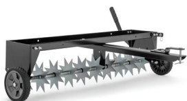
АЭРАТОР 586 63 69-01