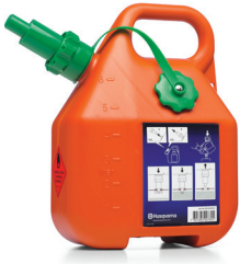
КАНИСТРА ТОПЛИВНАЯ 505 69 80-01