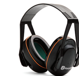
НАУШНИКИ ШУМОЗАЩИТНЫЕ 505 69 90-12