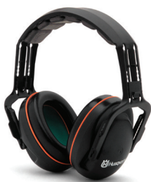
НАУШНИКИ ШУМОЗАЩИТНЫЕ С ОЧКИ ЗАЩИТНЫЕ CLEAR МЯГКИМ НАГОЛОВНИКОМ 544 96 38-01 505 66 53-04