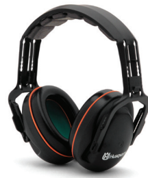
НАУШНИКИ ШУМОЗАЩИТНЫЕ STRIMMER HEAD A15B МЯГКИМ НАГОЛОВНИКОМ 505 66 53-04