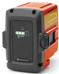
АККУМУЛЯТОР HUSQVARNA BLI20 967 09 17-01