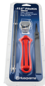
ЗАТОЧНЫЕ НАБОРЫ 505 69 81-25