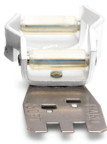
КОМБИНИРОВАННЫЕ ШАБЛОНЫ ДЛЯ ЗАТОЧКИ 505 69 81-09