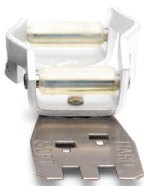
КОМБИНИРОВАННЫЕ ШАБЛОНЫ ДЛЯ ЗАТОЧКИ 505 69 81-09