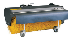
TRO040 - FRONT MOUNTED ROTARY BROOM 544 92 16-01