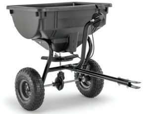
РАЗБРАСЫВАТЕЛЬ-СЕЯЛКА 30КГ 589 40 93-01