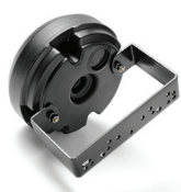
ПРОТИВОВЕС КО ВСЕМ ТРАКТОРАМ БЕЗ ТРАВСОБОРНИКА 505 54 92-01