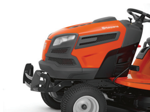
БАМПЕР С ЗАЩИТОЙ ОТ ВЫСОКОЙ ПОРОСЛИ 505 56 88-13