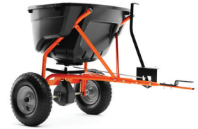
РАЗБРАСЫВАТЕЛЬ 967 02 72-01