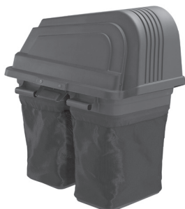
2-Х СЕКЦИОННЫЙ ТРАВСОБОРНИК 960 73 00-22