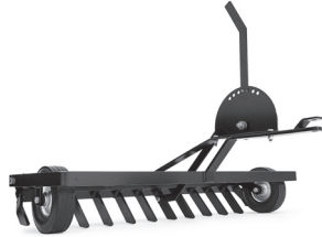
ПРИЦЕПНЫЕ ГРАБЛИ ДЛЯ ГРАВИЯ 953 51 24-01