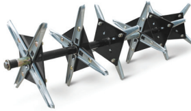
СМЕННАЯ НАСАДКА - АЭРАТОР 588 21 27-01