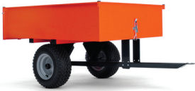
ПРИЦЕП PROF1 953 51 17-02