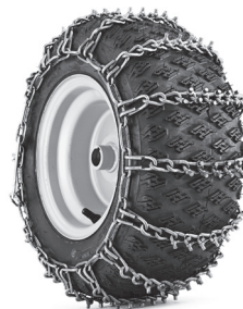
ЦЕПИ НА ЗАДНИЕ КОЛЕСА 18" 964 99 43-01