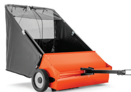
SWEeper 582 71 99-01