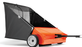
МУСОРОПОДБОРЩИК/ ТРАВСОБОРНИК 586 63 65-01