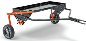
ПРИЦЕПНАЯ МНОГОФУНКЦИОНАЛЬНАЯ ПЛАТФОРМА 586 63 72-01