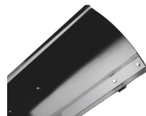
РЕЗИНОВАЯ НАКЛАДКА К ОТВАЛУ 5449217-01 966 00 19-01