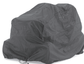
ЧЕХОЛ ДЛЯ ТРАКТОРА 505 63 08-80