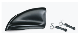
TRO033 - MULCH PLATE 960 71 00-03