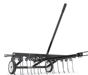
ПРИЦЕПНЫЕ РАБЛИ ДЛЯ МХА (ДЛЯ ВСЕХ МОДЕЛЕЙ) 586 63 66-01