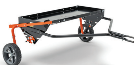
ПРИЦЕПНАЯ МНОГОФУНКЦИОНАЛЬНАЯ ПЛАТФОРМА 586 63 72-01