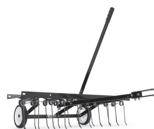
ПРИЦЕПНЫЕ РАБЛИ ДЛЯ МХА (ДЛЯ ВСЕХ МОДЕЛЕЙ) 586 63 66-01