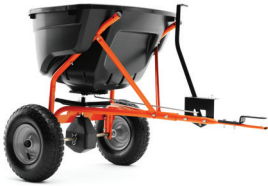
РАЗБРАСЫВАТЕЛЬ 967 02 72-01