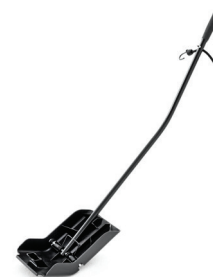
ЗАГЛУШКА VIOSLIP ДЛЯ СТ 154 (97CM) ДЛЯ МОД. С 2011 Г.В. 960 71 00-38