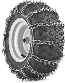
ЦЕПИ НА ЗАДНИЕ КОЛЕСА 18" 964 99 43-01