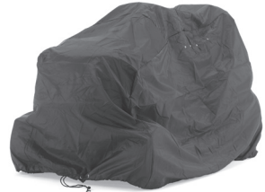
ЧЕХОЛ ДЛЯ ТРАКТОРА 505 63 08-80