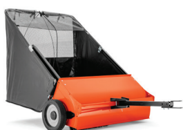
SWEEPER 582 71 99-01