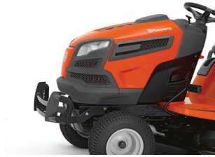
БАМПЕР С ЗАЩИТОЙ ОТ ВЫСОКОЙ ПОРОСЛИ 505 56 88-13