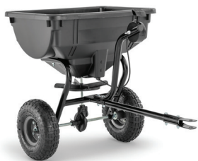
РАЗБРАСЫВАТЕЛЬ-СЕЯЛКА 30КГ 589 40 93-01