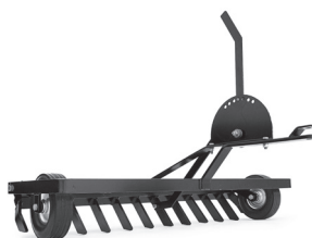
ПРИЦЕПНЫЕ ГРАБЛИ ДЛЯ ГРАВИЯ 953 51 24-01