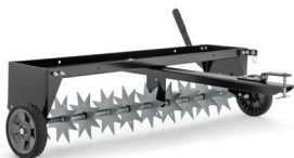
АЭРАТОР 586 63 69-01