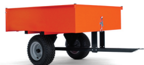
ПРИЦЕП PROF1 953 51 17-02