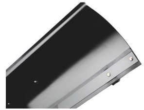
РЕЗИНОВАЯ НАКЛАДКА К ОТВАЛУ 5449217-01 966 00 19-01