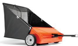
МУСОРОПОДБОРЩИК/ ТРАВСОБОРНИК 586 63 65-01