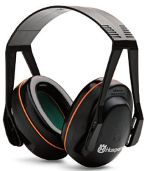
НАУШНИКИ ШУМОЗАЩИТНЫЕ 505 69 90-12