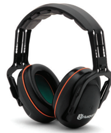
НАУШНИКИ ШУМОЗАЩИТНЫЕ С МЯГКИМ НАГОЛОВНИКОМ 505 66 53-04